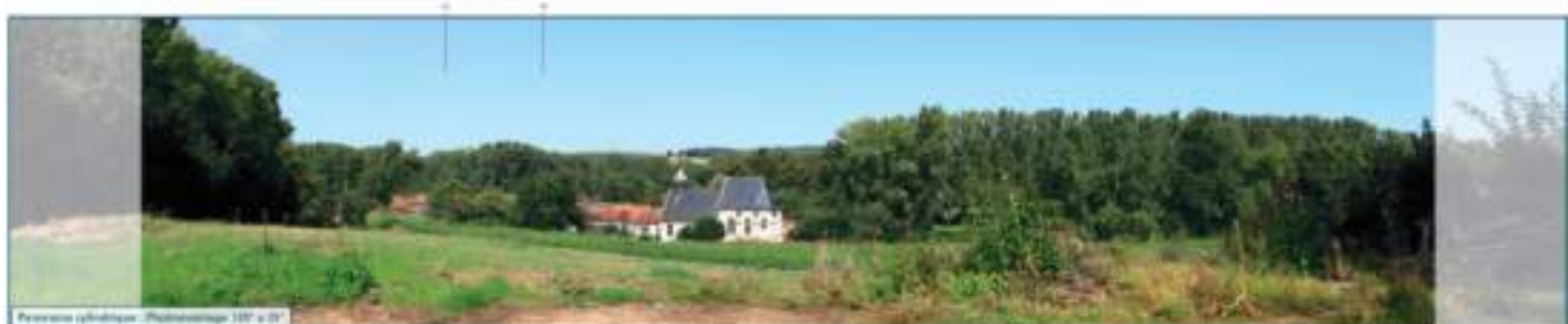
Vue sur l'église de Frohen-sur-Authie Le futur parc du Fossé Chatillon s'installe à l'arrière de la ripisylve de l'Authie. Grâce à ce paysage semi-fermé, une grande partie du parc sera masquée par le relief et ses boisements.