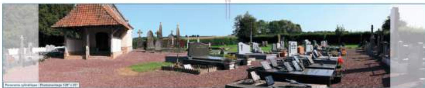
Vue sur la chapelle St Roch de Vaux Le parc éolien de Fossé Chatillon ne sera pas visible, les deux éoliennes sont entièrement masquées par le relief ondulé de ce territoire.

Certaines prises de vue sont présentées ci-dessous. Au total, 56 photomontages ont été réalisés, ils seront tous consultables en mairie et sur Internet durant l'enquête publique.