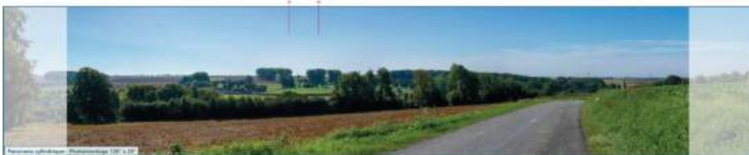
Vue sur l'église Saint-Sulpice de Willeman Depuis la route départementale 98, le projet de Fossé Chatillon ne sera pas visible. Les deux éoliennes s'installent à l'arrière-plan. Le relief combiné au tissu boisé dense masquera entièrement le projet.